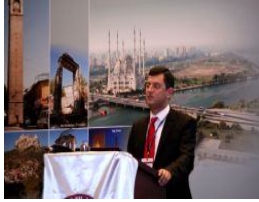
TEB Genel Sekreteri Ecz. Özgür ÖZEL