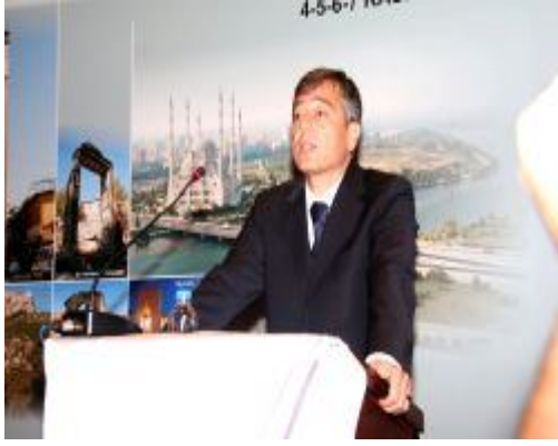
TEB Genel Başkanı Ecz. Erdoğan ÇOLAK